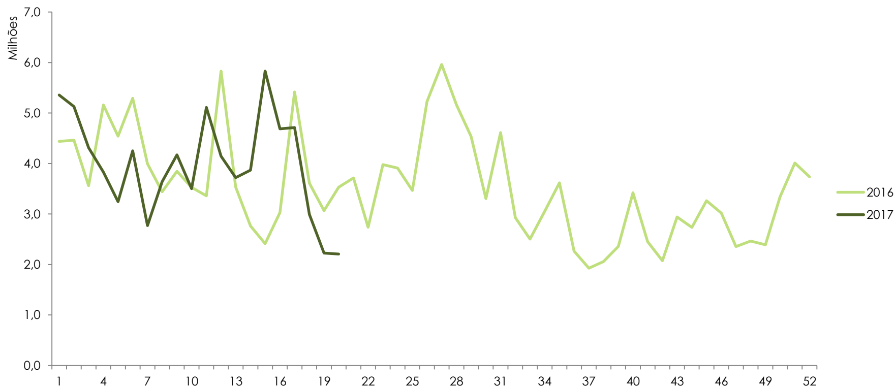
Público por Semana 2016 / 2017